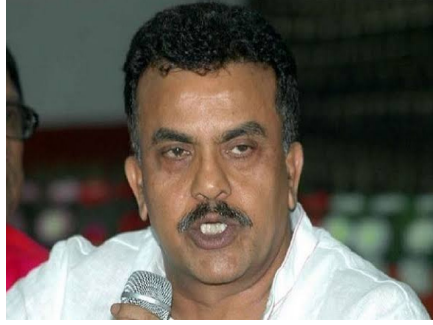
उठा रहे हैं। मगर तीन तिगाड़े काम बिगाड़े वाली सरकार

संजय निरुपम ने अपने ऑफिशल ट्विटर हैंडल से ट्वीट किया, 'हमारे नेताओं का तर्क है कि बीजेपी को रोकने के लिए हम शिवसेना से हाथ मिलाने का जोखिम