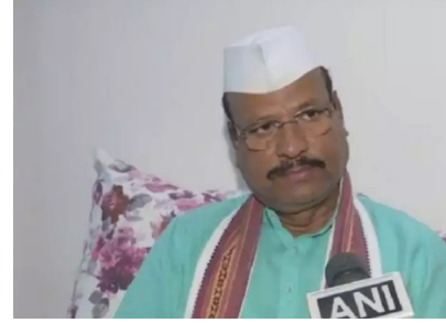
उनके सिर फोड़ दिए जाएंगे। इन विशेष मामलों के तहत हम अस्पताल में उनके इलाज की व्यवस्था

सत्तार ने कहा, 'बीजेपी किसी भी विधायक की खरीद-फरोख्त नहीं कर पाएगी। लेकिन जो भी विधायकों की खरीद-फरोख्त की कोशिश करेंगे,